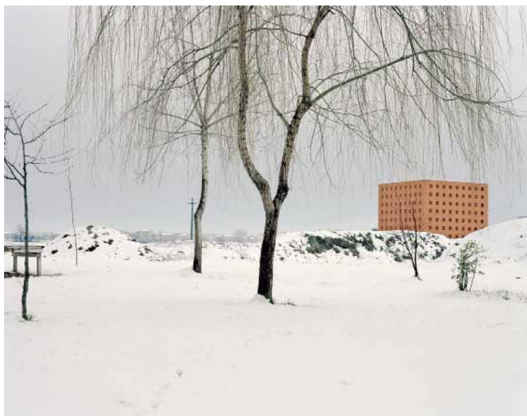
Due scatti di Modena (sopra) e Versailles (sotto), realizzati da Luigi Ghirri nel 1985.

OGGI A RICOLLEGARE i tasselli di un percorso popolato di orizzonti, segni, objet trouvé è un nuovo libro, The Complete Essays 1973-1991 , una raccolta completa degli scritti del grande fotografo emiliano. Sono tratti da libri e riviste. Parlano, in prima persona, dei temi più cari a Ghirri: dal paesaggio (italiano o di cartone) al tempo, alla poetica del frammento, a quella della catalogazione, alle infinite cartografie sentimentali raccolte nel suo immenso archivio di racconti minimi. Accompagna i testi una selezione di 50 immagini. Una storia nella storia. «I luoghi e gli oggetti che ho fotografato sono vere e proprie "zone della memoria"» confidava Ghirri. «Località che dimostrano più di altre che la realtà si è trasformata in un grande racconto». L'artista saluterà il mondo nella sua casa di Roncesesi. È 14 febbraio 1992. Il suo ultimo scatto è un'immagine di nebbia nella campagna.