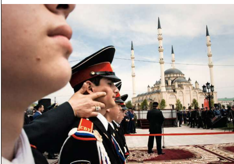
Défilé du Jour de la victoire de la Seconde Guerre mondiale, Grozny, Tchétchénie, 2010.

A voir : « Grozny, neuf villes », exposition aux Rencontres d'Arles, au Monopria, du 2 juillet au 23 septembre.