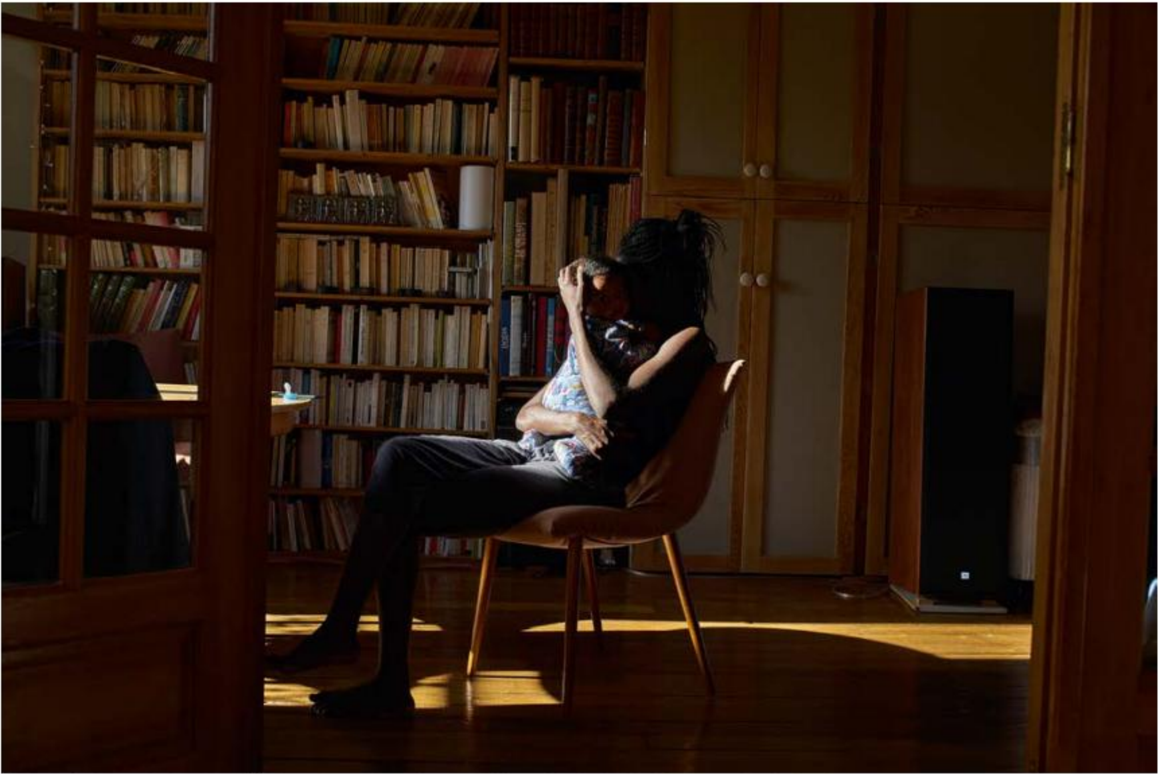
© Paul Graham, Paris, 11-15 th November, 2015, livre publié par Mack, 2016. Courtesy Mack, Londres