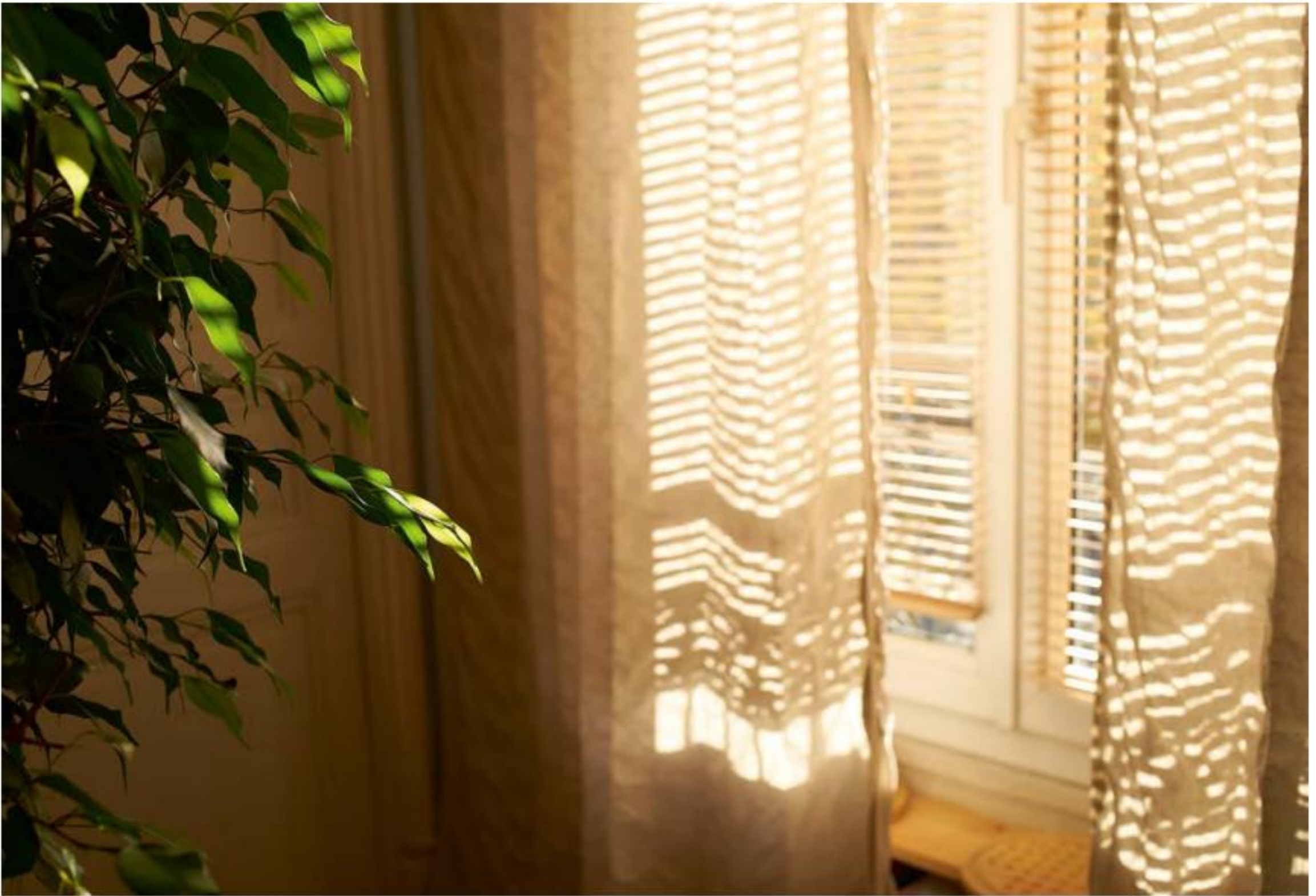
© Paul Graham, Paris, 11-15 th November, 2015, livre publié par Mack, 2016. Courtesy Mack, Londres