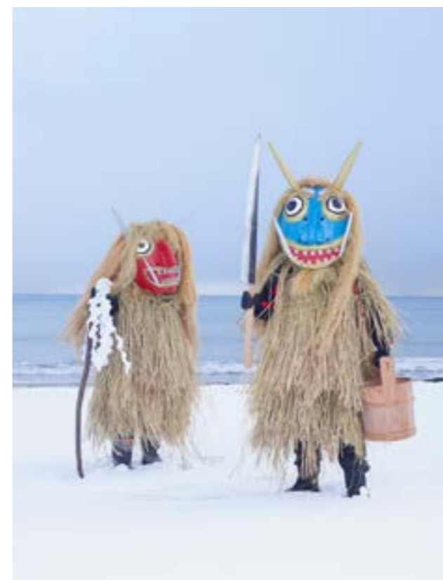
© C. Fréger, Namahage, Ashizawa, Oga, Akita Prefecture

Titolo: Yokainoshima Autore: Charles Fréger Uscita: 2016 Prezzo: 24,95 sterline Editore: Thames & Hudson - Edizione Italiana Peliti Editore Pagine: 255