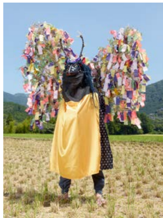
© C. C. Fréger, Mesujika, Yusuiani, Seijo, Ehime Prefecture